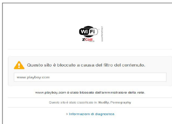
Figura - 4 -

InternetONE s.r.l. si riserva il diritto di modificare i filtri a suo insindacabile giudizio nel rispetto della normativa vigente.